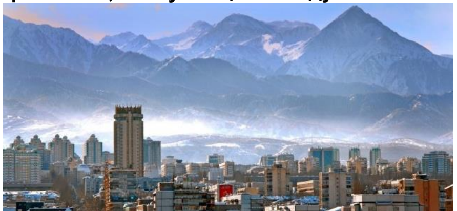
Современный город Алматы

“Господи, – подумала я, – если бы хоть одна капелька попала мне в глаза, ко мне вернулось бы зрение!” Вдруг в этот момент владыка повернулся в мою сторону и окропил мое лицо так, что святая вода